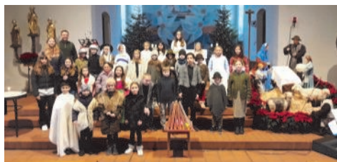
Kinderchor St. Korbinian, Weihnachten Kirchenchor St. Korbinian an Kirchweih